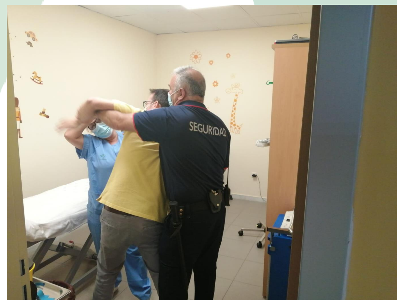
Momento en un simulacro de agresión