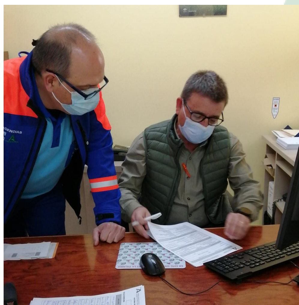
Momento en un simulacro de agresión: Cumplimentación de Hoja de Registro junto a Profesional Guía

El punto de partida de esta actividad comienza con la difusión del Plan de Agresiones en los Cursos específicos de PRL para mandos intermedios y aspirantes, en las distintas charlas informativas a los profesionales y a través del portal corporativo. Así mismo, se mejora del Plan de Comunicación, mediante la inmediata comunicación de la agresión al directivo responsable y acompañamiento desde primer momento y colocación de cartelería disuasoria de agresiones, en todos los centros, ubicándola en aquellas zonas donde son más susceptibles de originarse. Tras la implantación y difusión del Plan, se planifica la realización de simulacros de agresiones en aquellos centros en los que se producen mayor número de agresiones. Durante este acto, también se comprueba la activación del software antipánico en los terminales informáticos de los centros, y se le da difusión de esta medida a profesionales que puedan desconocer su existencia, así como de la aplicación Alertcops.