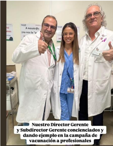
Nuestro Director Gerente y Subdirector Gerente concienciados y dando ejemplo en la campaña de vacunación a profesionales