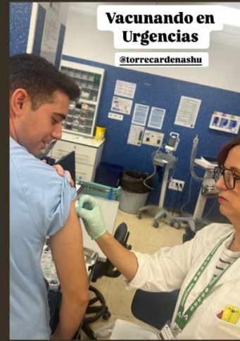
Vacunando en Urgencias @torrecardenashu