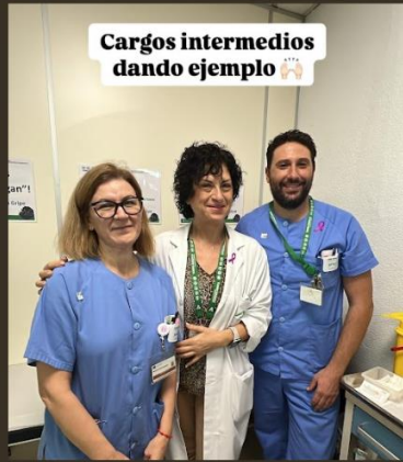
Cargos intermedios dando ejemplo