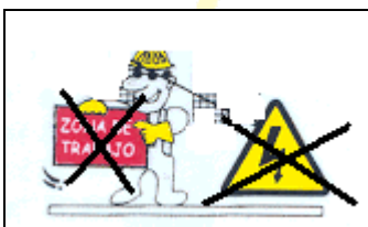
1. Retirar señalización de la zona de trabajo