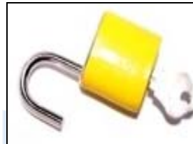
3. Desbloquear dispositivos de corte